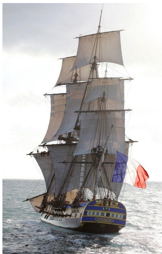
La frégate de la liberté - L'Hermione - Lafayette

11 juillet 2026 : Pour enfin achever ce fabuleux et légendaire Tour du Monde maçonnique, en embarquant sur l'Hermione, la frégate de la Liberté, pour une visioconférence surprise, toute « océanique », qui aura lieu le 11 juillet prochain.